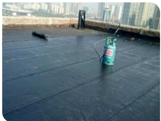
Bề mặt hoàn thiện

Xin vui lòng liên hệ với phòng kỹ thuật của công ty Việt Thái và xem xét tài liệu sản phẩm để được tư vấn.