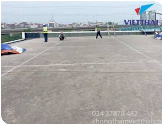
Chuẩn bị bề mặt