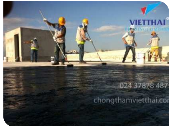
Thi công lăn lớp lót