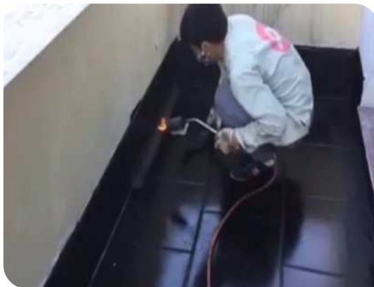
Xử lý góc chân tường