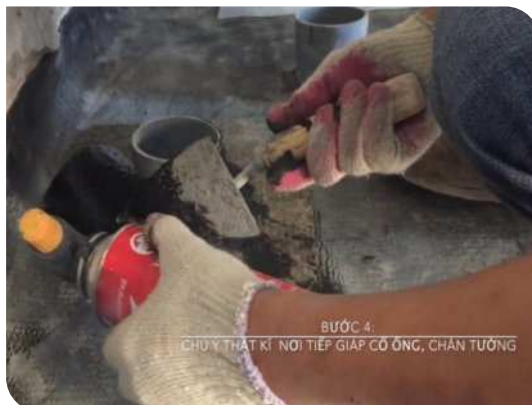
Xử lý cổ ống thoát nước