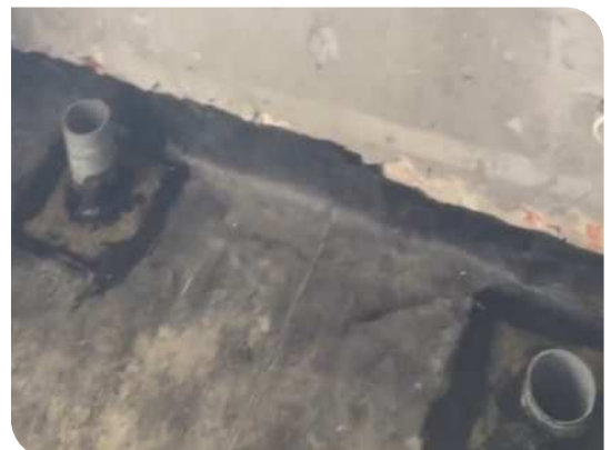
Hoàn thiện cổ ống và góc chân tường