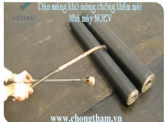
Cách khò tiêu chuẩn