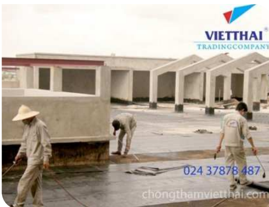
Thi công màng khô nóng