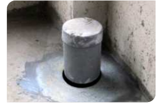
Bơm keo trám khe BS 8620S quanh cổ ống