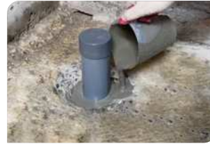
Thi công đổ vữa Lemax Grout LM-G650