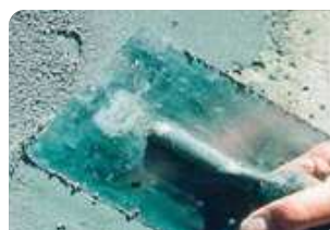
Trám và bề mặt bê tông bằng vữa sửa chữa Neorep