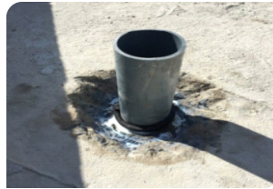
Vệ sinh cổ ống, quét thanh tương nở