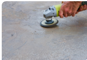
Sử dụng máy mài chà bề mặt bê tông