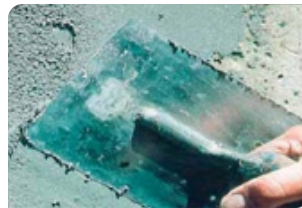
Trám vá bề mặt bê tông bằng vữa sửa chữa Neoprep