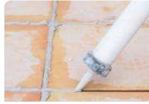
Trám vá mạch gạch bằng keo trám khe BS 8620S/ Jointex®