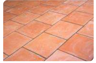
Bề mặt gạch đỏ đạt