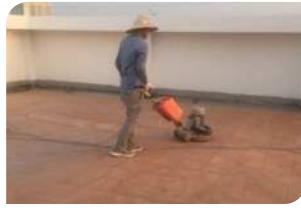
Sử dụng máy mài chà bề mặt gạch đỏ