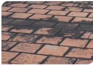
Bề mặt gạch đỏ chưa đạt