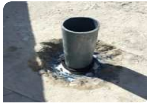
Vệ sinh cổ ống, quét thành trường nở