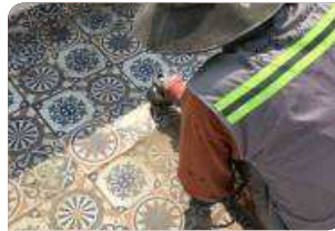
Sử dụng máy mài chà bề mặt gạch men