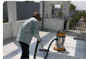
Vệ sinh, trám vá mạch gạch bằng keo trám khe BS 8620S/ Jointex®