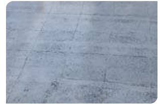
Bề mặt gạch men đạt