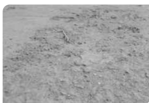
Bề mặt bê tông chưa đạt