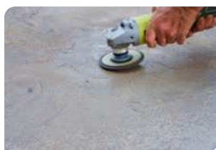
Sử dụng máy mài chà bề mặt bê tông