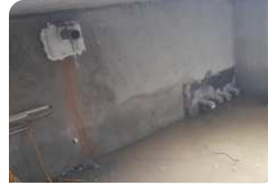
Thi công ghép cốt pha và đổ vữa Lemax Grout LM-G650