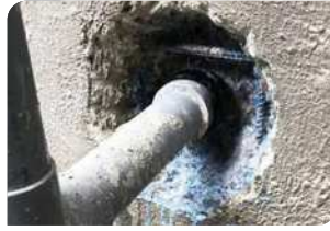
- Vệ sinh, quấn thanh tương nối - Quét chất kết nối Revinex (pha với nước theo tỉ lệ 1:4)