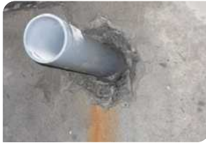
Đục vát quanh cổ ống