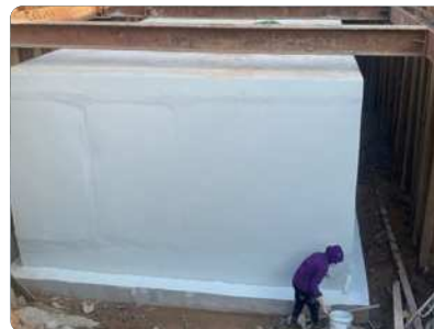
Bước 5: Bề mặt hoàn thiện (vật liệu đóng cứng hoàn toàn sau 7 ngày).