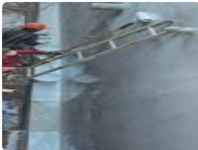
Bước 1: Quét lớp lót Acqua Primer NP pha với 25-30% nước sạch. Định mức: 0,14-0,18 kg/m 2 (vật liệu lót Primer phải được khuấy bằng máy khuấy tốc độ chậm trong vòng 3 phút trước khi thi công...)