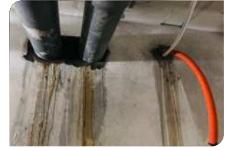
Trám và hoàn thiện bề mặt bằng vữa sửa chữa Neorep