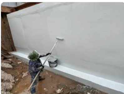
Bước 4: Thi công lớp phủ thứ 2 (nguyên chất), sau khi lớp 1 đã thi công được 12 giờ. Định mức: 0,5-0,6 kg/m 2