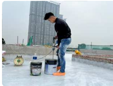
Bước 2: Hướng dẫn pha trộn vật liệu Polyurea R (thành phần A phải được khuấy kỹ trước khoảng 1 phút. Sau đó trộn thành B với thành phần A theo tỉ lệ 13A:6B theo định lượng và khuấy khoảng 3 phút bằng máy khuấy tốc độ chậm cho đến khi hỗn hợp đồng nhất.)