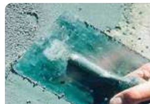
Trám vá bề mặt bê tông bằng vữa sửa chữa Neorep