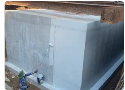
Bước 3: Thi công lớp phủ thứ 1 (nguyên chất) sau khi lớp lót kết thúc 24 giờ. Định mức: 0,5-0,6 kg/m 2