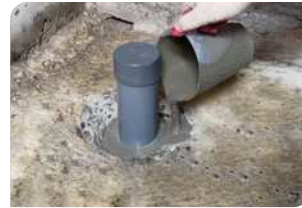
Thi công đổ vữa Lemax Grout LM-G650