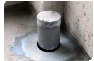
Bơm keo trám khe BS 8620S quanh cổ ống