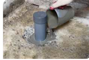
Thi công đổ vữa Lemax Grout LM-G650