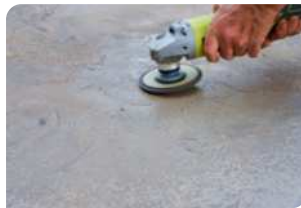
Sử dụng máy mài chà bề mặt bê tông