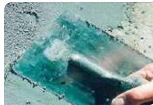
Trám vá bề mặt bê tông bằng vữa sửa chữa Neopress