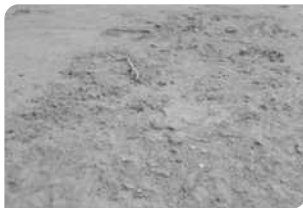
Bề mặt bê tông chưa đạt