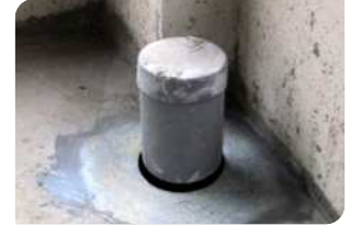
Bơm keo trám khe BS 8620S quanh cổ ống