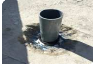
Vệ sinh cổ ống, quét thanh trướng nở