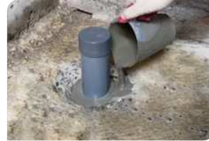
Thi công đổ vữa Lemax Grout LM-G650