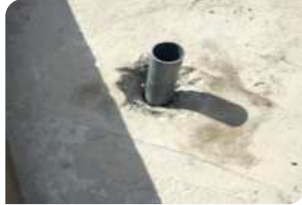
Đục vát quanh cổ ống, chèn xốp hoặc cấp pha bên dưới cổ ống