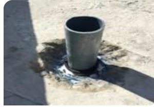
Vệ sinh cổ ống, quét thanh trướng nở