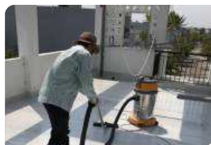
Vệ sinh trám vá mạch gạch bằng keo trám khe BS 8620S/ Jointex ®