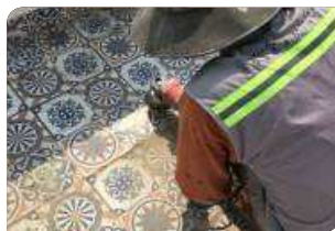
Sử dụng máy mài chà bề mặt gạch men