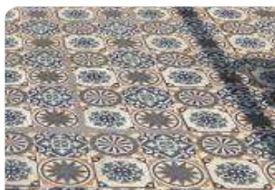
Bề mặt gạch men chưa đạt