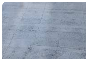
Bề mặt gạch men đạt