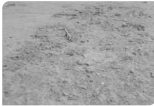
Bề mặt bê tông chưa đạt