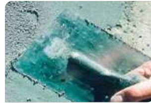
Trám vá bề mặt bê tông bằng vữa sửa chữa Neorex