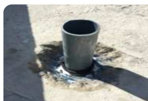
Vệ sinh cổ ống, quét thanh trường nở