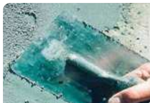
Trám vá bề mặt bê tông bằng vữa sửa chữa Neorep