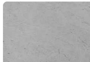
Bề mặt bê tông đạt