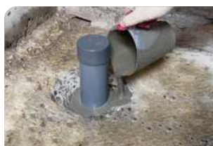
Thi công đổ vữa Lemax Grout LM-G650