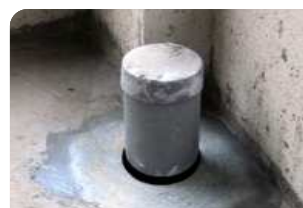
Bơm keo trám khe BS 8620S quanh cổ ống