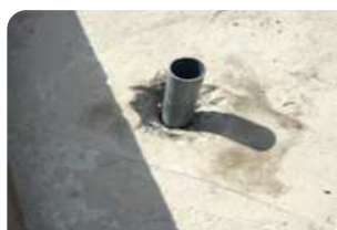
Đục vát quanh cổ ống, chèn xốp hoặc cốt pha bên dưới cổ ống