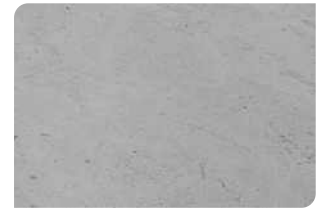
Bề mặt bê tông đạt