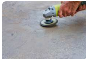
Sử dụng máy mài chà bề mặt bê tông