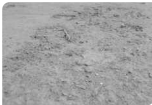
Bề mặt bê tông chưa đạt