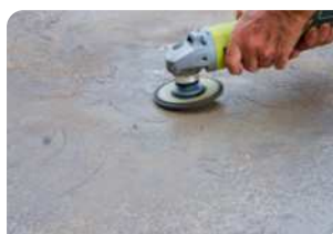
Sử dụng máy mài chà bề mặt bê tông