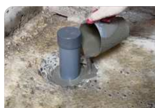
Thi công đổ vữa Lemax Grout LM-G650