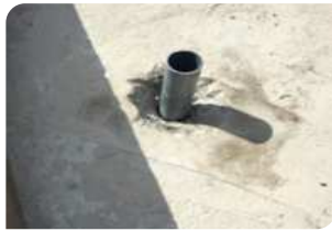
Đục vát quanh cổ ống, chèn xốp hoặc cốp pha bên dưới cổ ống